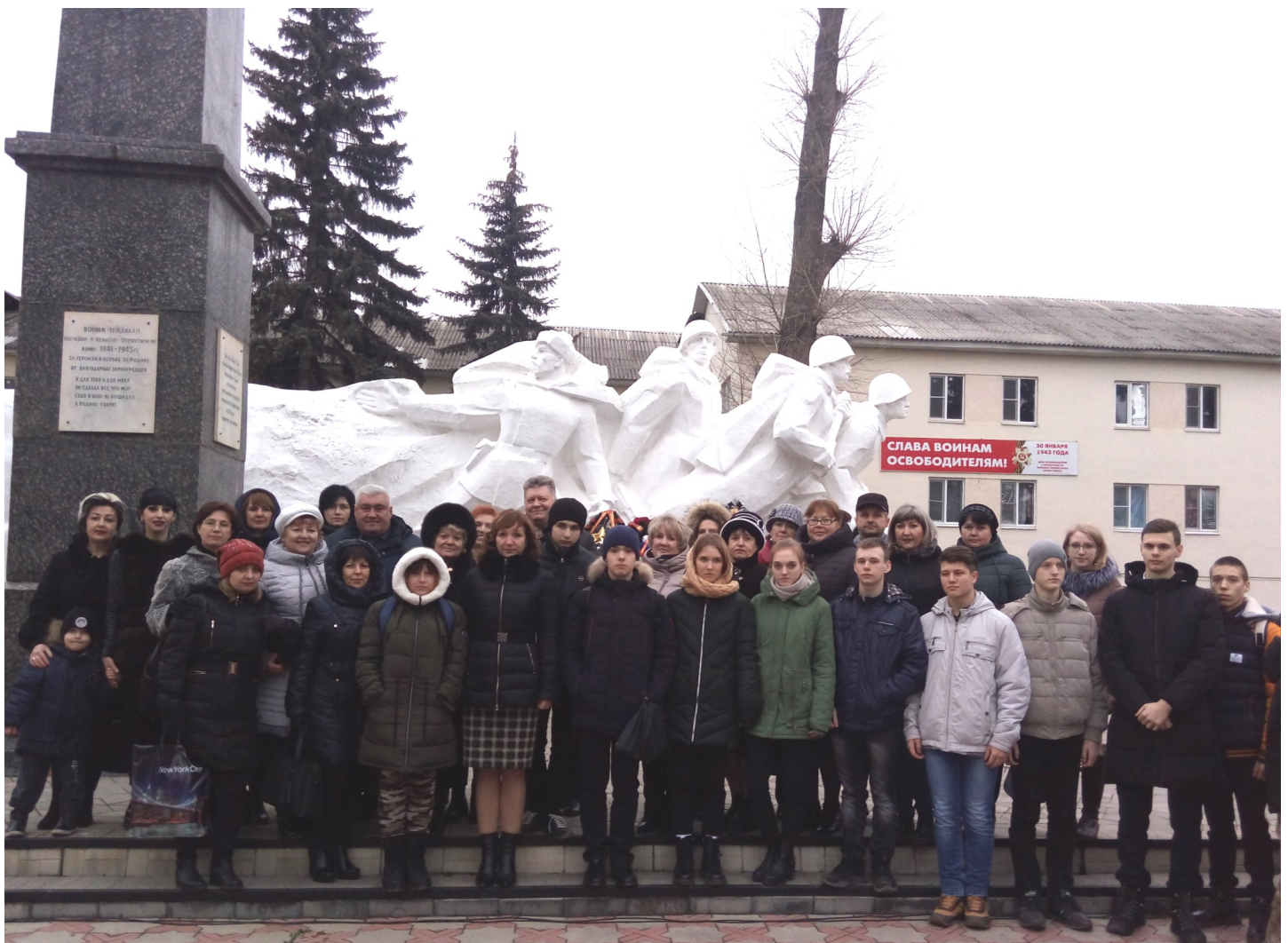
На фото: коллектив и обучающиеся школы-интернат, Л. Тутова - депутат Госдумы, Дзюба А.И. - Герой РФ.